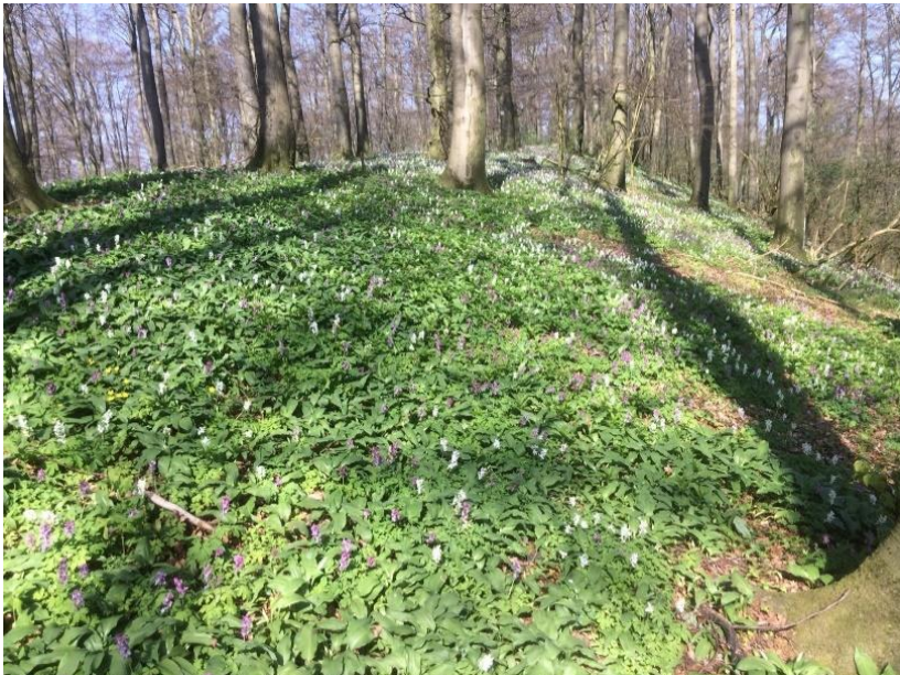
Bärlauchfeld am Wedeberg/Noller Schlucht – in Farbe nur auf der Homepage